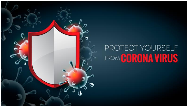
Figuur 1: bron Vecteezy.com

Wat de wetenschappers voorspeld hadden, komt uit. Het coronavirus is er nog steeds en de tweede golf wordt nog erger als de eerste. Dus “klassiek vergaderen” in ons lokaal mogen we vergeten. Iets plannen voor de volgende maanden in ons