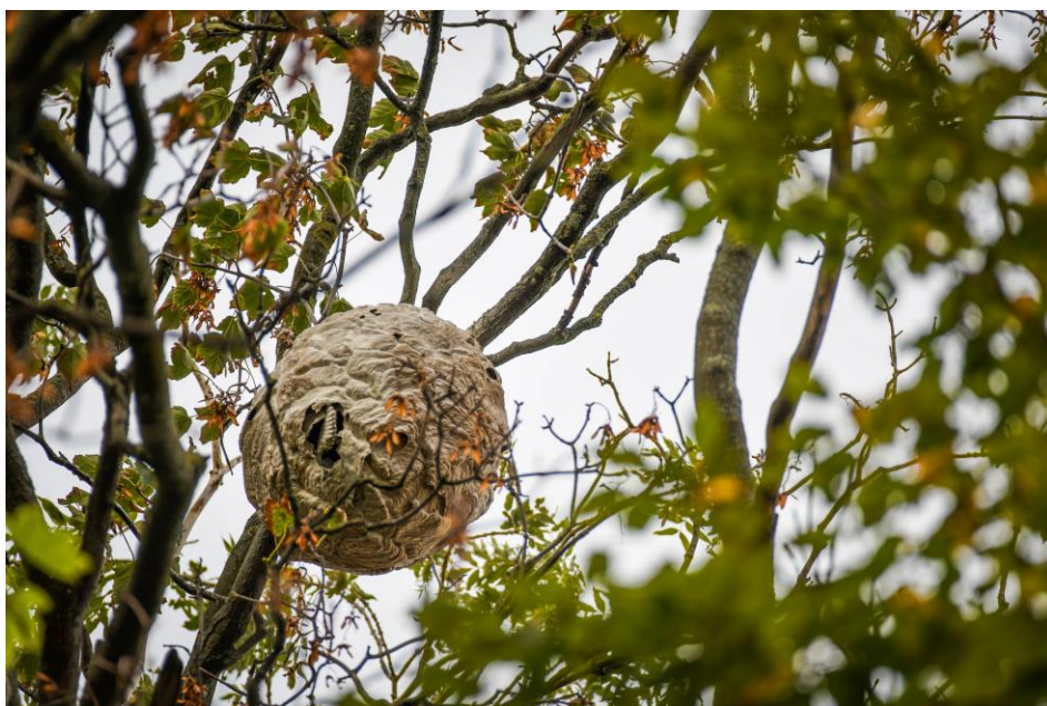
Figuur 4: nest van een Aziatische hoornaar

Maak je geen illusie, ze zitten vlakbij. Volgend jaar zal je ze wellicht aan je bijenvolken zien rondvliegen.