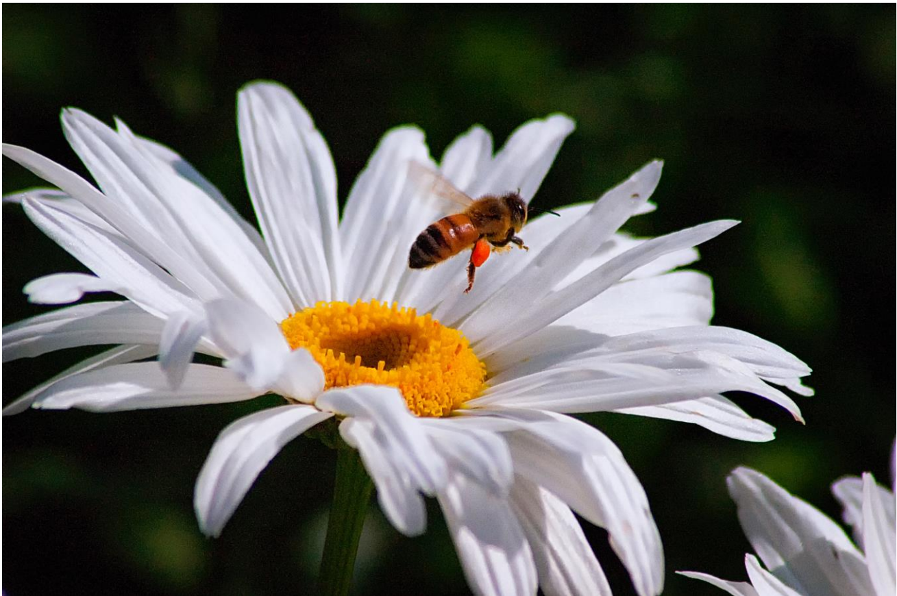
Figuur 2

Het belang van stuifmeel in de natuur en voor onze bijen kan niet genoeg onderstreept worden.