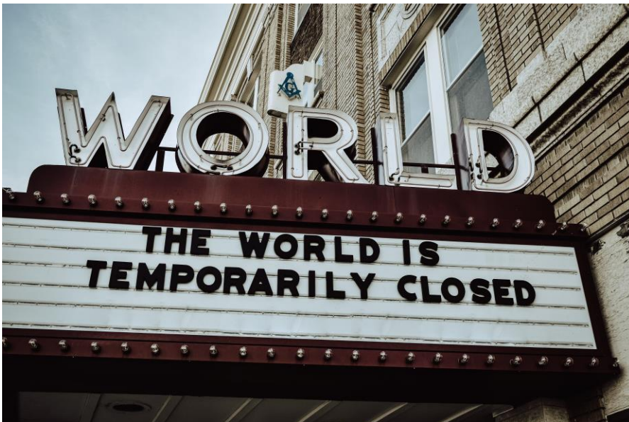
Figuur 1: De wereld mag dan al gesloten zijn, maar wij gaan door met onze activiteiten.

Via video-conferenties bieden we jullie nu voordrachten aan. Het is niet evident, want niet alle lesgevers staan open voor deze manier van lesgeven. Ze hebben natuurlijk gelijk als ze zeggen dat voordrachten geven voor een pc-scherm nooit het fysisch vergaderen kan vervangen. Een deel van de menselijke interactiviteit mis je natuurlijk op die manier maar we voorzien niettemin de mogelijkheid om tijdens de videoconferentie vragen te stellen. En gelukkig kunnen we op die manier ons verenigingsleven toch nog laten doorgaan. Natuurlijk missen we de leuke babbel met collega imkers en voor het biertje, koffietje of wijntje moeten we zelf zorgen. Maar laten we het positief bekijken, een voordracht volgen vanuit onze luie zetel, lekker warm thuisblijven, een drankje en knabbeltje naar ieders keuze en niemand die zeurt dat we niet te laat mogen thuiskomen, toch ook voordelen niet.....?