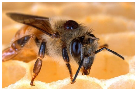
Figuur 2: bij met varroa

Na het slingeren van de zomerhoning is het weer tijd voor de varroabehandeling. Ieder kiest zijn methode natuurlijk 2 , maar begin hiermee zo snel mogelijk na het slingeren van de zomerhoning. Honeybee Valley heeft in 2018 een brochure uitgegeven over “Veilig varroa bestrijden en materiaal desinfecteren met organische zuren“. Je kan die brochure hier