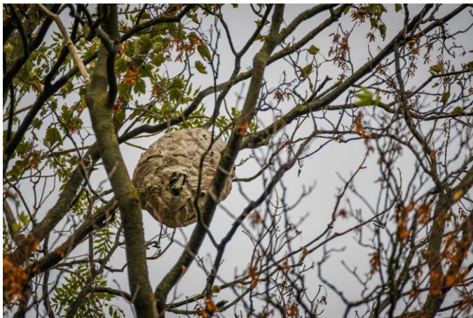
Figuur 2: nest Aziatische hoornaar (Hannelore Smitz)

Er zijn vorig jaar een paar nesten gevonden en vernietigd in Leuven, maar