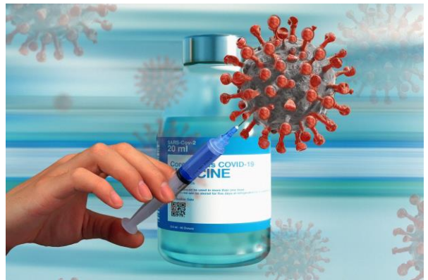
Figuur 1:

Denk aan je gezondheid en die van je familie, vrienden en burens.