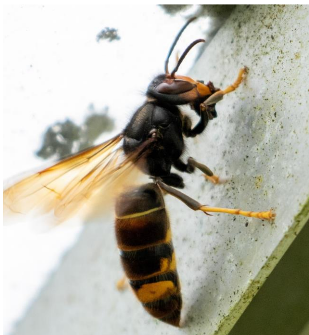
Figuur 3: Aziatische hoornaar (Frederik Lembrecht)

maak je geen illusies : die beestjes rukken verder op.