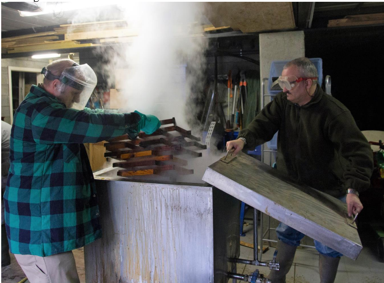
Figuur 4: ramen worden afgekookt in natronloog

Na een pauze nemen we de draad weer op. Leden, die hun uitgesmolten ramen willen reinigen en ontsmetten zullen dat kunnen. Dit is wel als de coronamaatregelen dat toelaten.