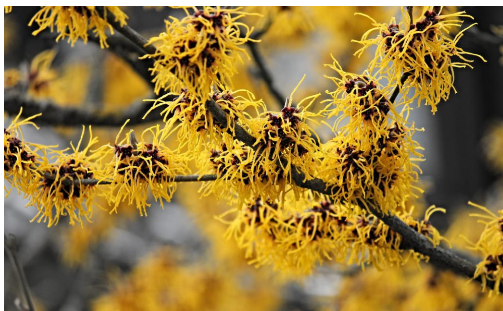
Figuur 2: toverhazelaar (hamamelis)

Het arboretum van Kalmthout is een wonderlijke plek. Sinds 1856 zijn er in de