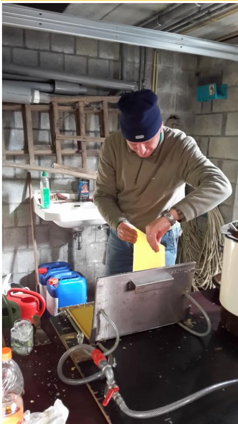
Figuur 6: een waswafel wordt uit het waswafeltoestel gehaald